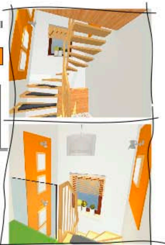
▲ Machen die Vorstellung leicht Von raumkonzept7 erstellte 3D-Perspektiven

SO SETZT RAUMKONZEPT 7 WOHNIDEEN UM Vom Treppenhaus bis zur Mini-Küche – Matthias Gerlach von raumkonzept7 entwickelt individuelle Lösungsvorschläge zum Festpreis: das 'kleine Raumkonzept' mit coloriertem Grundriss kostet 97 Euro, das 'mittlere' mit individueller Möbelliste 147 Euro. Im 'großen' Paket für 177 Euro sind außerdem u. a. 3D-Perspektiven enthalten. Die Preise gelten je Raum bis 40 qm Größe, Ausstattung bis 25 000 Euro. Ausführliche Infos und Beratungsbögen zum Herunterladen bei www.raumkonzept7.de